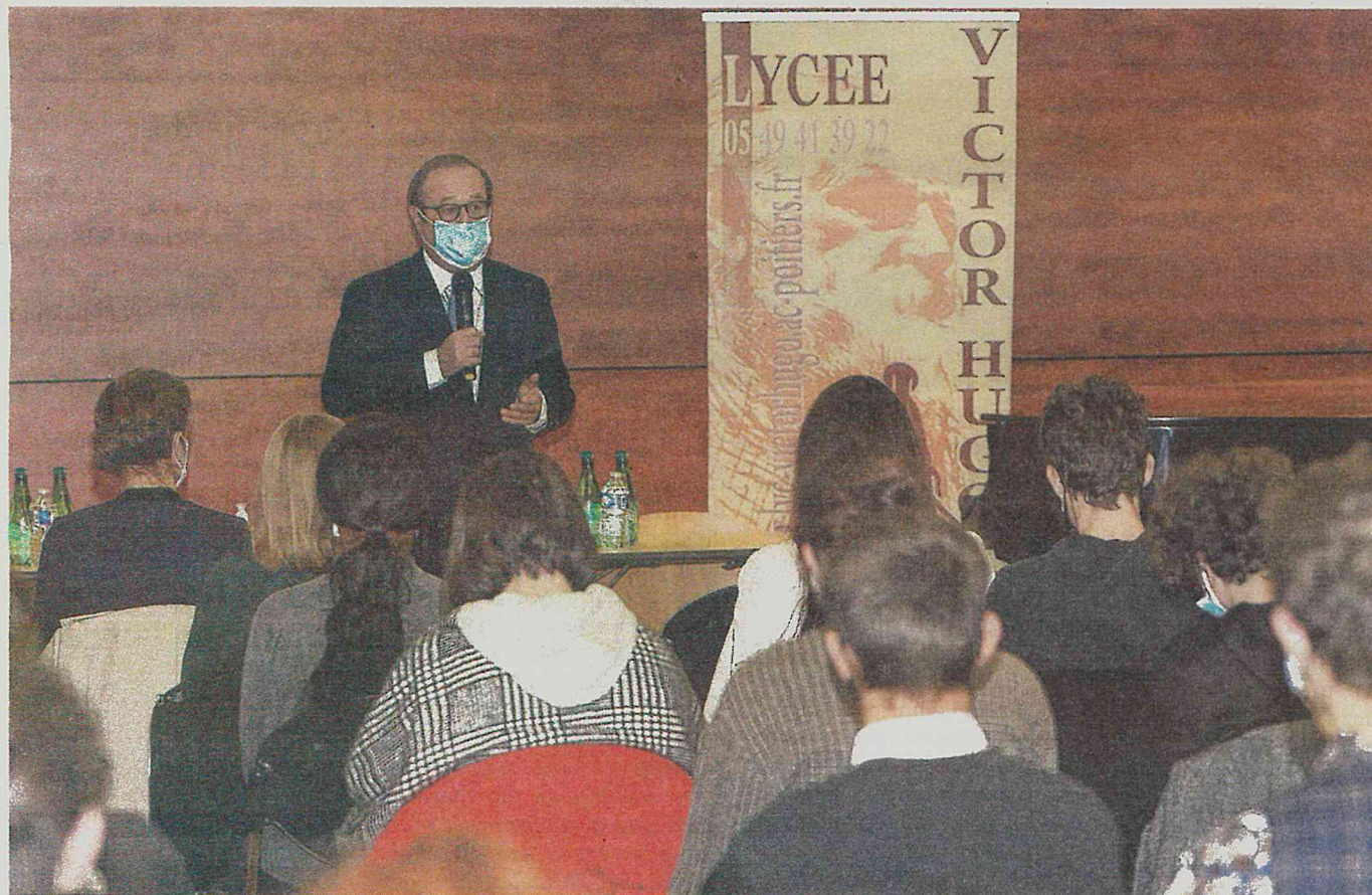
L'ancien chef de l'État s'est transformé, hier, pendant plus d'une heure, en professeur d'éducation civique devant les lycéens de Victor-Hugo.