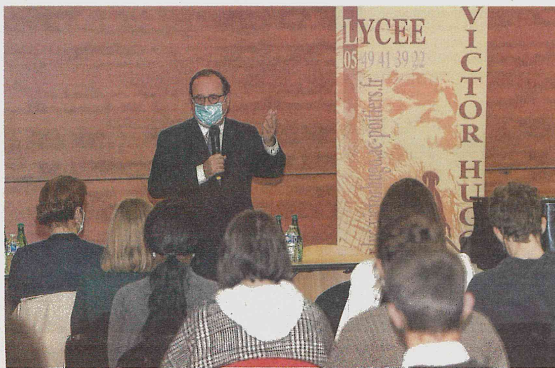
François Hollande, ancien président de la République, a répondu aux questions (qu'il a découvert) des élèves de première du lycée Victor-Hugo.

La parole redevenue libre lui a donné l'air d'un jeune retraité de la politique. Disponible, souriant, affable, François Hollande, l'ancien président de la République, continue son tour de France pour transmettre, parler de son expérience, s'inscrire dans une logique pédagogique avec son second album, Leur État , visant à démocratiser des notions d'éducation civique. Avant Confolens et Chasseneuil-sur-Bonnieure (Charente), il s'est arrêté, sous protection, à Poitiers. Au lycée Victor-Hugo pour un échange calibré avec des élèves en classe de première, option géopolitique et Sciences Po. François Hollande a laissé à Paris la langue de bois tout en évitant de jeter la pierre dans les jardins de l'Élysée de l'actuel locataire. Enfin presque.